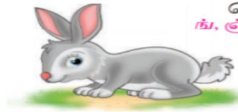
மெல்லினம் ங், ஞ், ண், ந், ம், ன்

மெய் எழுத்துகள் ஒலிக்கும் கால அளவு - அரை மாத்திரை