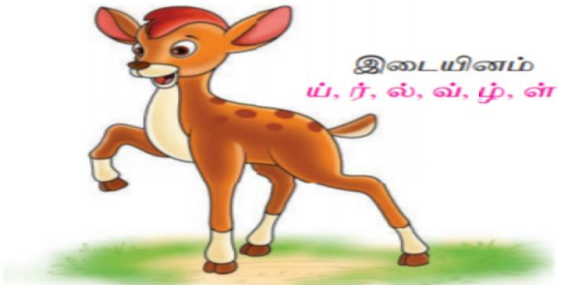
இடையினம் ய், ர், ல், வ், ழ், ள்